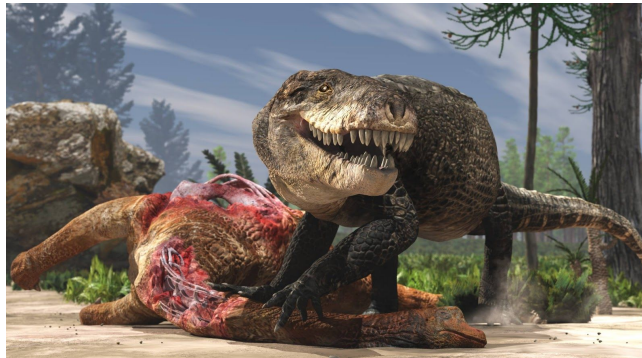
© Giant Prehistoric Crocodile Relative from Madagascar Had T. rex ...Sci-News.com

L'animal est apparenté aux crocodiles mais aussi aux Notosuchia, leurs cousins du Jurassique. Il s'agit d'une créature d'environ 7 m de long qui vivait au Jurassique, il y a plus de 170 millions d'années. Ce lointain ancêtre des crocodiles modernes possédait des dents aussi longues et terrifiantes que celles des tyrannosaures apparus 100 millions d'années plus tard. Cette arme redoutable lui permettait, assurément, de broyer des os et d'occuper une place de choix dans la chaîne alimentaire.