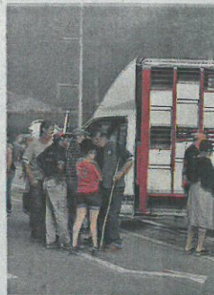
Samedi, barrage filtrant aux en

Alors que la pression monte autour de la prédation de l'ours dans les Pyrénées, les seize conseillers départementaux du groupe majoritaire (socialiste et société civile) de l'Ariège ont demandé hier le retrait pur et simple de l'animal.